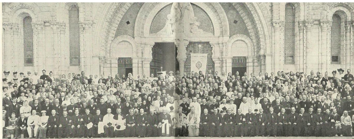
Účastníci druhé české pouti do Lurd roku 1907 před růžencovou basilikou v Lurdech.