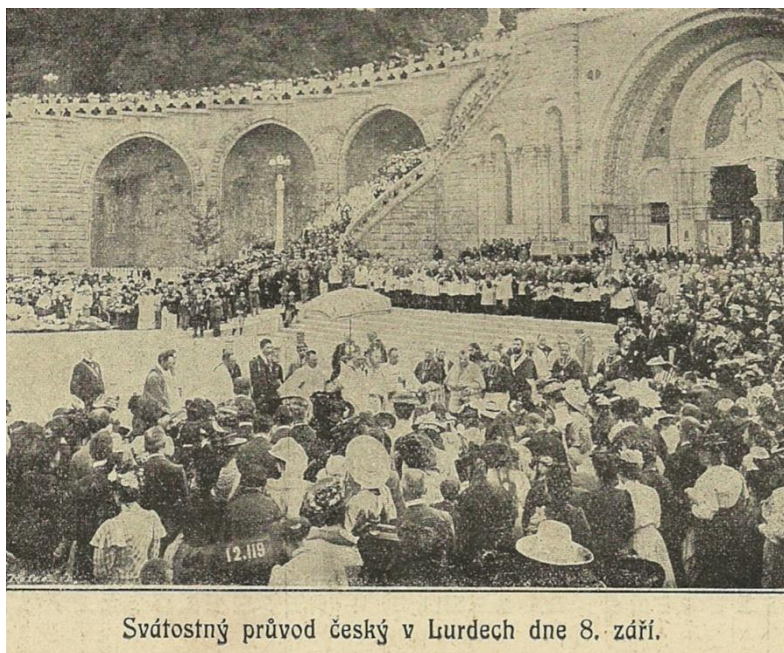
Svátostný průvod český v Lurdech dne 8. září.