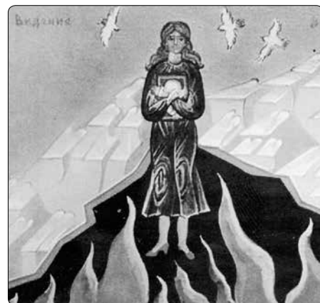
„Obráťte se! Všichni planeme v hříších!“ (deskové vyobrazení ikony sv. Mikuláše)