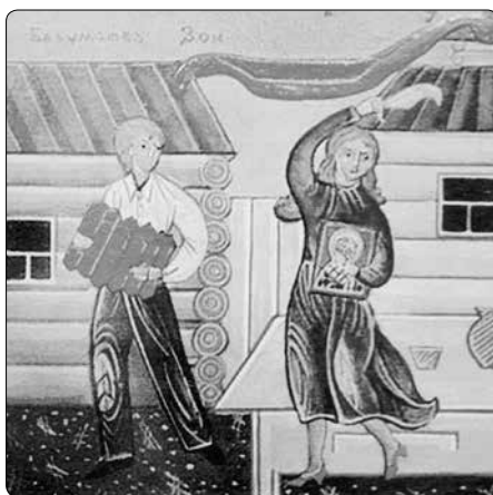
Zojino šílenství (deskové vyobrazení ikony sv. Mikuláše)