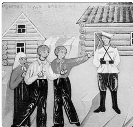
Zatajení divu před úřady (deskové vyobrazení ikony sv. Mikuláše)

Když mnoho lidí vidělo takové úsilí komunistů, připadalo jim, že „není kouře bez ohně“: pokud je vedení tolik horlivé v likvidaci té záležitosti, skrývá se za tím skutečná událost. Nové podrobnosti byly předávány šeptem, ale nejdůležitější je to, že lidé začali masově chodit do svatyní. V městě a v okolí zbylo málo