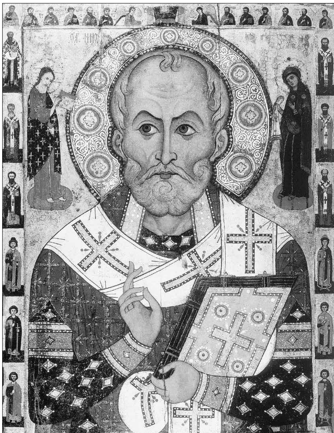
Velká (184 cm vysoká) ikona sv. Mikuláše namalovaná v roce 1294 pro Lipnyjský kostel sv. Mikuláše v Novgorodu