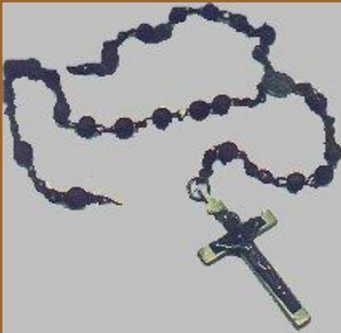
(růženec sv. Bernadety)

Díky za to, že jsem byla tou Bernadetou, jíž vyhrožovali vězením, protože jsem viděla, Matko, tebe..., tou Bernadetou tak ubohou a zbytečnou, že když ji viděli, říkali si: "To má být ona?"