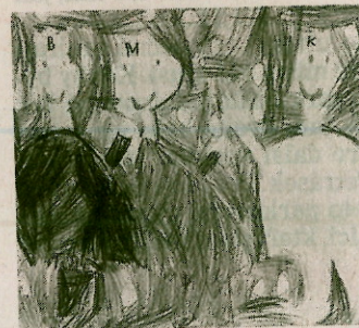
Některé z obrázků, které uspěly v soutěži.