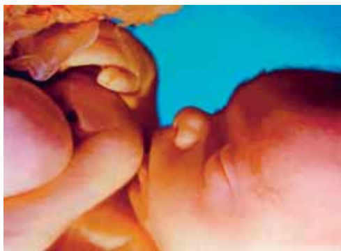
Vývoj člověka v lůně matky – 20. týden od početí

Jolanta Tecza-Ćwiercz, Žródlo 24. 10. 2010, zkrácený překl. -red-