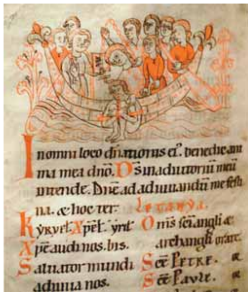
Ordálie vodou (německý rukopis, kolem 1180)

S ordáliemi souvisí také tortura, tzn. právo soudní moci použít při výslechu obviněného mučení. Torturu znalo již pohanské římské právo, které ji chápalo jako důkazní prostředek: Když se vysly-