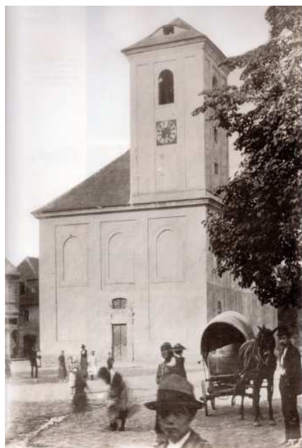
Kostel Narození Panny Marie v Trmicích kolem roku 1898, ještě před přestavbou