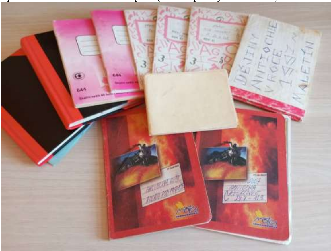
9. příloha – Foto přepsaných a tištěných osobních zápisků (osobním přístrojem 12. 4. 2024)