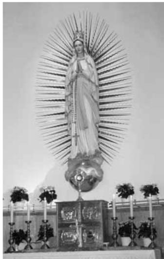
Altarul principal la Wigratzbad

lumânare?” a propus soțul și curând a venit cu lumânare mare cu o sticlă pentru a nu o stinge vântul. Comentariul meu față de moartea care se apropia a fost: „Aceasta este lumina veșnică!”