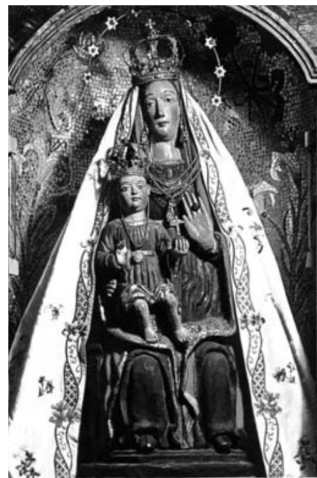
Statuia miraculoasă a Fecioarei Maria