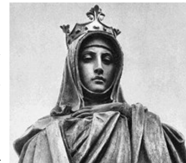
Svatá Anežka – socha u sv. Václava

Ač byla Anežka jmenována abatýší, podle legendy si přála být řádovou sestrou a spíše ostatní obsluhovat než být obsluhována. Tato kdysi kněžna a princezna, málem císařovna se neštítala zatápnět v pokojích, v klášterní kuchyni připravovala pokrmy, které pak posílala churavým a nemocným, myla misky a jiné nádoby, poklízela příbytky sester, prala špinavé hadry nemocných sester a jejich oblečení i po nocích zpravovala. Za vše pak požadovala odměnou jen milost Boží. Práce a obětování se pro druhé byly jen malou částí Anežčina nového životního stylu.