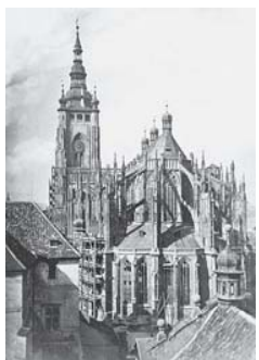
Katedrála sv. Víta

populisté. Právě hrdinkou, světící a člověkem, který měl odvážnou vizi pro budoucnost, byla svatá Anežka.