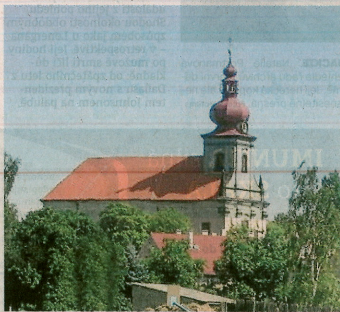
PROJEKT USPĚL. Záchrana varhan je zase nadějnější.

„Chtěli bychom poděkovat Nadaci ČSOB, která nám umožnila vybráním našeho projektu v podzimním kole ČSOB pomáhá regionům oslovit rodáky, patrioty, nadšence z naší obce, širo-