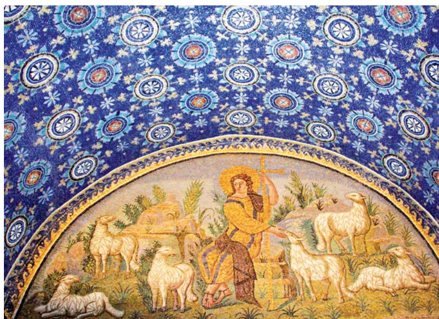
Dobrý pastýř, Mauzoleum Gally Placidie, Ravenna.

A proto se její údy o sebe navzájem starají; trpí-li jeden úd, trpí s ním všechny, a dostává-li se jednomu údu slávy, všechny se s ním radují. Slyší totiž a zachovávají ona slova: Milujte se navzájem. Ne jako ti, kdo šíří zlobu, ani jako se milují lidé, protože jsou lidé, ale abyste se navzájem milovali jako ti, kdo se milují, protože jsou všichni bohové a synové Nejvyššího, takže jsou bratry jeho jediného Syna; abyste se navzájem milovali takovou láskou, jakou je miloval on, když je chtěl přivést k cíli, kde se naplní jejich touha, kde se nasytí dobrem veškerá jejich touha. Neboť tehdy, až Bůh bude „všechno ve všem,“ všechny touhy pomínou.