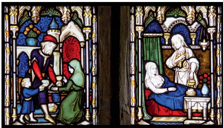
Skutky milosrdenství. Kostel svatého Kříže, Gilling East, Yorkshire.

Homilie papeže Františka při mši svaté o neděli Božího milosrdenství