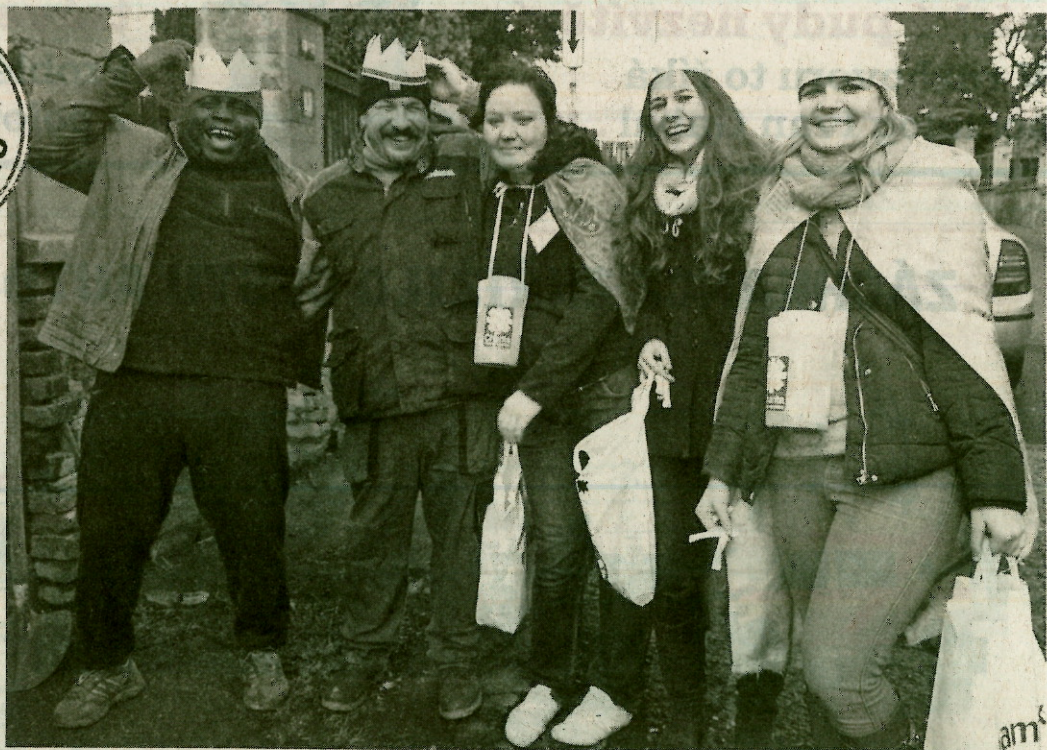
Tříkrálová sbírka v Duchcově.

Možnost podpořit Charitu ČR je i nadále prostřednictvím dárcovské DMS ve tvaru DMS KOLEDA na číslo 87 777. Cena jedné DMS je 30 Kč.