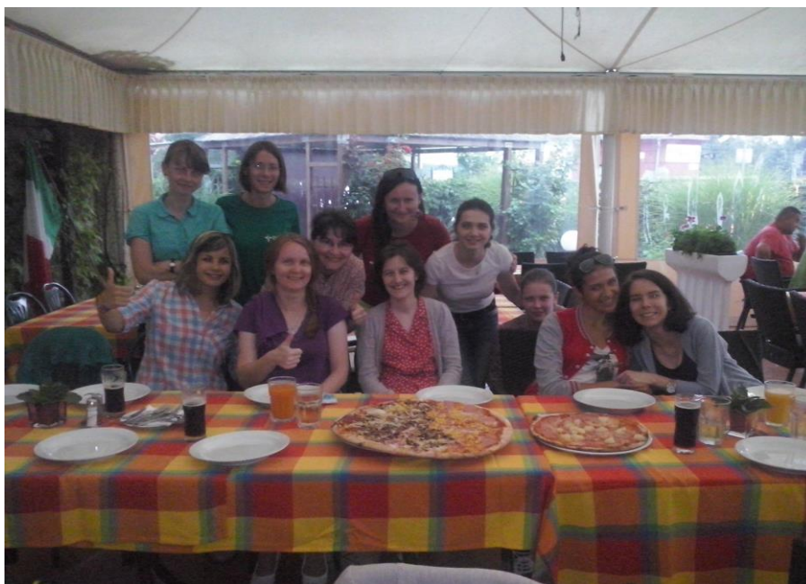
Naše společné radostné chvíle při pizze... (Dunajská Lužná, červenec, 2014)

...proběhla za účasti sedmi zájemkyň (spolu s námi členkami komunity Miles Jesu celkem 11) v pestré atmosféře, kde měla svoje místo ranní a večerní modlitba, katecheze, čtení Písma svatého, rozhovory, sport, hra, zábava, odpočinek a na závěr dne mše svatá. Naučily jsme se i něčemu novému (například výrobě růží z růz. barev. ubrousků)...těmi jsme potom ozdobili Pannu Marii v jeskyňce (viz foto dole 1,2,3,4 ) a vzájemně jsme se tak mohly obohatit tím, co kdo uměl a věděl :).