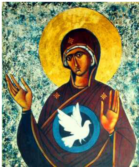
Svatá Maria z Nazaretu Ikona školy