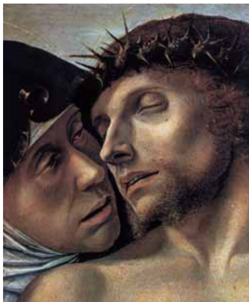
Pieta, Giovanni Bellini, Miláno

U Ježíšova kříže vytrvali ti, kteří nad své vlastní zájmy dali přednost přátelství a lásce. Láska