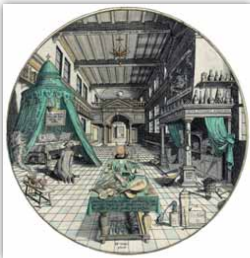
Alchymistova laboratoř. Amphitheatrum Sapientiae Aeternae, Heinrich Khunrath (1595).

Nejnámější středověkou pověrou byla astrologie, tj. výklad lidských osudů a událostí podle