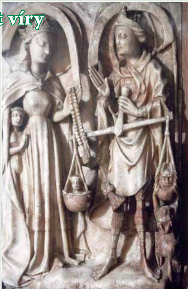
Soud nad duši, Pembroke College, Cambridge

„Jaká je tedy Kristova spravedlnost? Je to především spravedlnost pocházející z milosti, kde člověk není spasitel a neuzdravuje ani sebe sama, ani druhé. Skutečnost, že obmytí se naplňuje v ‚krvi‘ Kristově, znamená, že člověk není od tíže svých vin osvobozen osobními oběťmi, nýbrž láskyplným gestem Boha, který jde až tak daleko, že zakusí ‚prokletí‘ vyhrazené člověku, aby mu dal ‚požehnaní‘ vyhrazené Bohu (srov. Gal 3,13-14). Dalo by se však hned namítnout: co je to za spravedlnost, jestliže spravedlivý umírá za viníka a viník naopak dostává požehnaní, které patří spravedlivému? Že by každý dostal opak toho, co mu náleží? Ve skutečnosti se zde Boží spravedlnost projevuje jako hluboce odlišná od lidské spravedlnosti. Bůh za nás ve svém Synu zaplatil výkupné, cenu skutečně závatnou. Tváří v tvář spravedlnosti kříže se člověk může bouřit, protože představuje