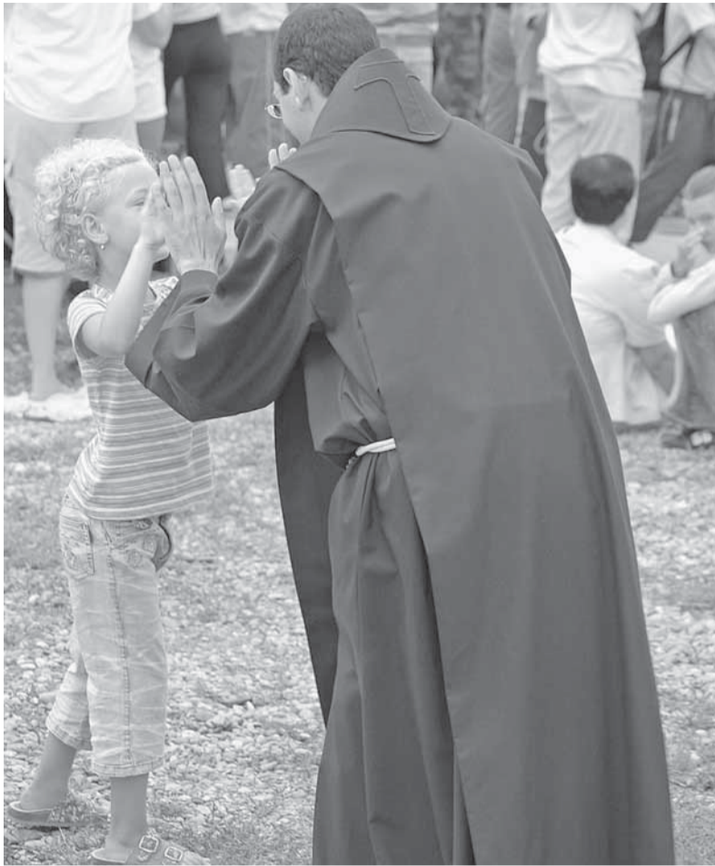
Nebudete-li jako děti...

Ježíš k sobě volá jako názorný příklad dítě. Jeho sociální bezvýznamnost a nevinost chybějícího sebepečet je přímým protikladem postoje učedníků. Ježíš dítě „staví“ doprostřed, je to tedy dítě, které sotva chodí, možná ho Ježíš přidržuje a dřepí vedle něj. Jeho „jestliže se neobrátíte“ (sv. Řehoř Nazíánský použité řecké sloveso chápe jako „jestliže se pokoríte“), „a nebudete jako děti“ (18,3), kterým je poměřování na větší,