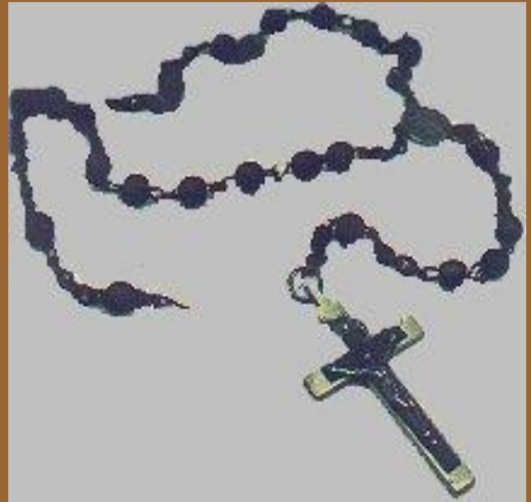
(růženec sv. Bernadety)

Bernadetou, kterou si lidé prohlíželi jako vzácné zvíře.